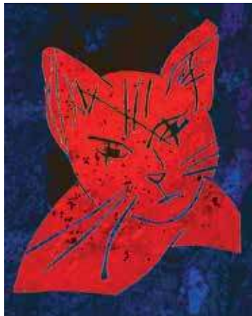
Chat rouge et bleu